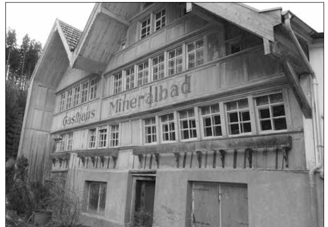
Zum modernen Heilbad gehört nach wie vor die uralte, noch immer geöffnete Wirtschaft Mineralbad.

«Das Bad Unterrechstein», Autor Arthur Oehler, Gestaltung Antonia Bannwart, Bildbandformat, 96 Seiten, reich illustriert, CHF 28.–, kann im Heilbad, bei Tourist Info und im Hotel «Linde», Heiden, bezogen werden.